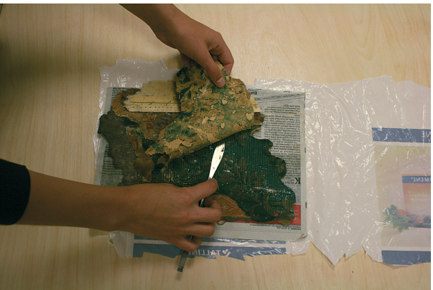
Pärast seismist 5-8 tundi niiskete ajalehtede vahel saab tapeedikihthe hõpsalt üksteisest näiteks spaatli abil eraldada.

katta kilega, et niiskus mõjuks. Ajalehed ei tohiks veest tilkuda! Tapeedid võivad niiskuma jääda 5-8 tunniks. Seejärel tuleb tapeedid üksteisest ettevaatlikult spaatli abil eemaldada ning lasta ajalehepaberite vahel kuivada. Hea oleks veel kergelt niiskeid tapeedifragmente puidust või vineerist plaadi all ajalehtede või happevabade paberite vahel pressida. Kui tapeedid on kuivatatud, tuleb neile hariliku pliatsiga õrnalt märkida leiukoht, tuba, fragmenti eemaldamise kõrgus ja kiht. Näiteks: Tatari 22; tuba 2; alt 4. kiht, 1,3 m kõrguselt.