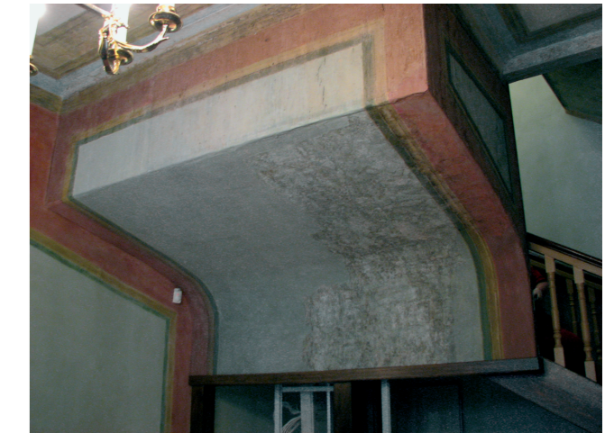
All: Maalitud tapeet Viimsi mõisa fuajee laes.

Kõige lihtsam on eristada koridoride, köökide ja vannitubade tapetseerimiseks mõeldud keraamilise plaadi või kivi imitatsiooniga seinakatted, mida leidub paljude puithoonete üldkasutatavates ruumides.