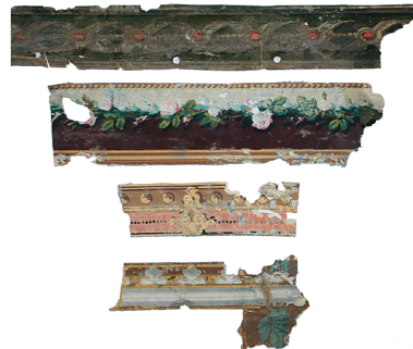
Paremal: Tallinnas J. Köleri 9 asunud nüüdseks lammutatud majast pärinevad bordüürid.

Seetõttu on elu- ja pereruumid olnud enamasti tapetseeritud. Harvemini kasutatavates esinduslikes ruumides kaunistati seinu maalingute ja luksuslike tapeetidega. Käsitsitrukitud tapeete leidub paljudes mõisates ja jõukates linnamajades, kuid antud tehnikas valminud bordüüre on kasutatud suurel hulgal ka miljööväärtuslikes piirkondades asuvates lihtsamates hoonetes. Valdav osa tapeetidest on toodeti valtstrüki tehnikas.