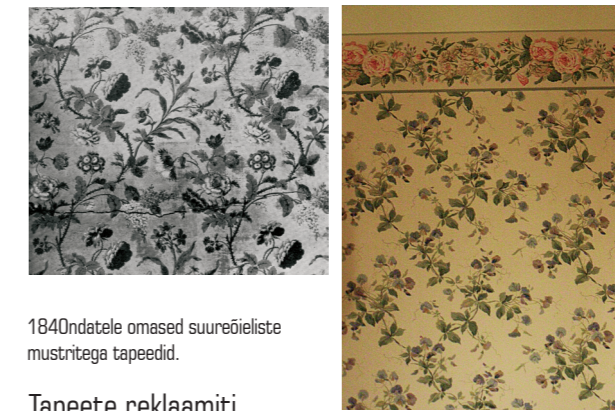
1840ndatele omased suureõeliste mustritega tapeedid.

Tollaegne tapeediturg pakkus suurt valikut. Perekondlikes eluruumides kasutati heledal põhjal suureõeliste mustritega tapeete, karamelltrükis teostatud siidiimitatsioonide, drapeeritud pitsi ja tülli kujutavaid mustreid. Raamatukogudesse, söögitubadesse ja piljardiruumi sobisid tumedad raamistatud tapeedid, mis tihti kujutasid tihedat lehestikku, gobelääne või kullatud nahka. Kamina- ja uksepealseid kaunistati dekoratiivsete paneelidega. Ka erinevaid illusionistlikke arhitektuurseid detaile sai tapeedina seina kleepida. Rikkam tarbija sai endale lubada loodusvaateid, antiikmütoloogiat või ajaloolisi stseene kujutavaid panoraamtapeete.