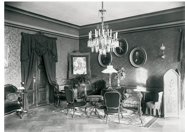
Ülal: 19. sajandi interjäär. TLM Fn 8516:13

Tapeet on sama tähtis osa ajaloolisest interjöörist kui antiikne mööbel, seina- ja laemaalingud, parkett ja tekstiilid. Sarnaselt teistele ruumikujundusdetailidele esindab tapeet kindlat ajajärku, stiili ning jutustab endiste omanike ilumeest, harjumustest ning sotsiaalsest staatusest. Tapeete analüüsid on võimalik määratleda ka ruumi ajalooline otstarve ning saada terviklikum ülevaade selle ajaloolisest kujundusest.