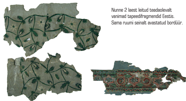
Nunne 2 laest leitud teadaolevalt vanimad tapeedifragmendid Eestis. Sama ruumi seinalt avastatud bordüür.

Paberist seinakatteid on interjööride kaunistamiseks järjepidevalt kasutatud juba üle 300 aasta. Vanim tapeedinäide pärineb 16. sajandi Inglismaalt. Hetkel Eestis teada olevad vanimad tapeedid on Tallinna vanalinnast, Nunne 2 hoonest leitud nn etruski mustri tapeedi fragmendid, mis on dateeritavad 1790ndatesse.