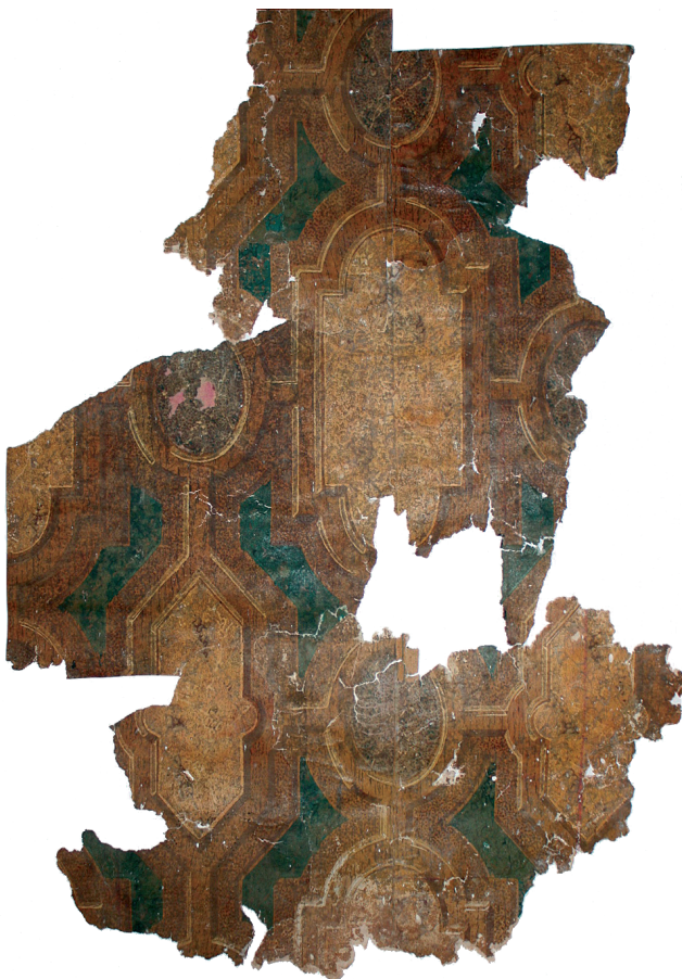
Seinalt eemaldada õnnestunud tapeedifragmente kokku sobitades on võimalik saada mustrist hea ettekujutuse.