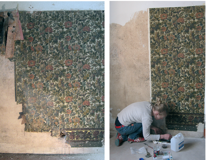
Puurmani mõisa söögisaali tapeet enne restaureerimist.

Tapeetide säilitamise keerukamate etappide läbimiseks tasub küsida spetsialisti nõu.