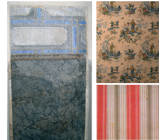
Vasakul: Maidla mõisa marmoreeritud tapeet.

Uhkeldavates barokk- ja rokokoointerjöörides muutus tapeet väga tavaliseks. Moodi tulid triibud, pitsi ja väreleiva siidi imitatsioonid, graafilisi lehti kujutavad mustrid, marmoreeritud paberid ning erinevate allegooriliste stseenide ja arabeskidega paneelid. Väga hinnatud olid ka Hiinast toodud käsitsimaalitud tapeedid, mida Euroopa tapeeditootjad imiteerisid veel 19. sajandi lõpuni.