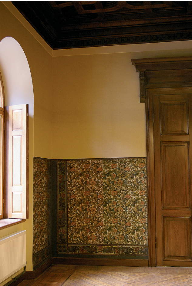
All: Pärast restaureerimist.