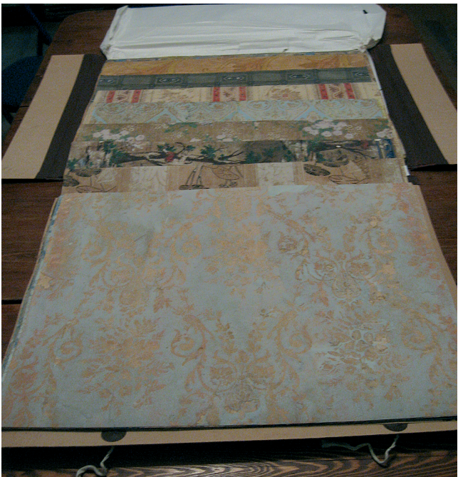
Ühe ruumi seintel leitud tapeetidest koostatud kataloog.

Kataloogi koostamiseks tasub tapeet paanilaiuselt seinalt maast-laeni lahti lõigata, et saada ülevaade kogu seina kujundusest. Kui seda pole võimalik teha, tuleks lõigata paanilaiused ning umbes 50 cm pikkused tükid lae alt ja puusakõrguselt, kus on bordüüre enim kasutatud. Tasub uurida ka nurki ning põranda- ja uksealuste taguseid pindu.