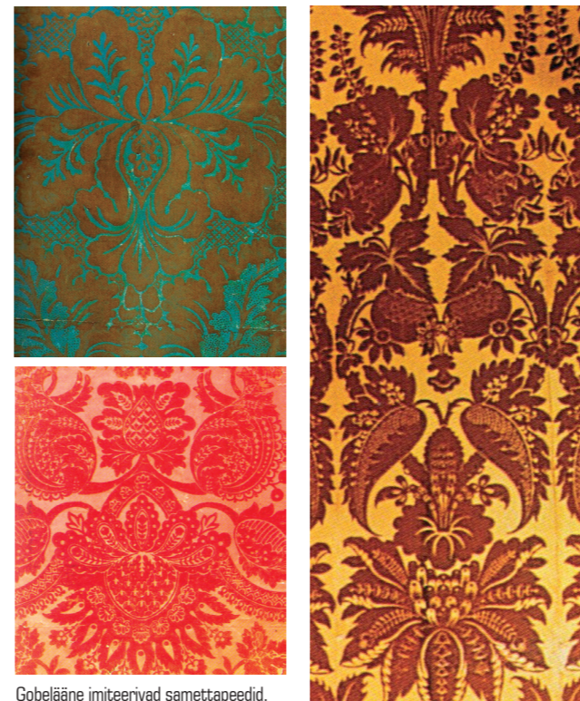
Gobelääne imiteerivad samettapeedid.

18. sajandi algust iseloomustavad luksuslikud samet-tapeedid, mis imiteerivad gobelääne.