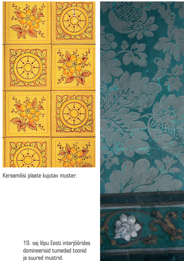
Keraamilisi plaate kujutav muster.

Kui 1830ndatel aastatel hakati valmistama tapeedi-paberit rullina, andis see tõuke uue trükitehnika – valtstrüki - kujunemisele. Sarnaselt puiduplokkidele kasutatakse ka valtstrüki puhul kõrgreljeeftrüki võtet, ainus erinevus on trükkimiseks kasutatavad rullid ehk valtsid, mis võimaldavad tapeete toota suuremates kogustes ja palju kiiremini kui plokkidega. Iga värvi jaoks on vaja eraldi valtsi.