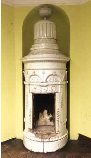
< Salongi kamin.

väikesesse salongi, mille sein ülemist osa kaunistab savanni kujutav maaling. See avastati 2000. aasta alguses ning restaureeriti 2002. aasta märtsis. Ruume eraldava kaarja ava kohal on veel tänapäevalgi näha kahte konksu, millele on ilmselt kinnitunud eesriie. Selle abil sai grotti visuaalselt muust maailmast eraldada. Tähelepanelik külastaja leiab groti seinas aga veel ühe väikese kaarja salaukse, mis viib esikulaadsesse vaheruumi. Sealt pääseb piki kitsast müüritreppi mõisa teeninduskorrusele.