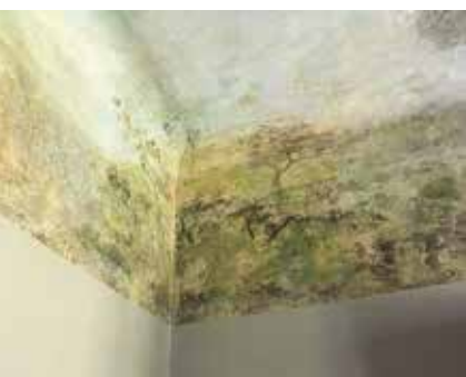
< Maaling mõisahärra magamistoas.

Esmapilgul iseloomutus vaheruumis leidub ka üks aare – mõisa kapptualett. Selliseid ruume ei tasu kunagi alahinnata, kuna sarnaselt mõisa eluruumidele olid ka tualetid üldjuhul rikkalikult tapetseeritud. Kui üldkasutatavatest ruumidest on need kergesti kahjustuvad seinakatted aegade jooksul eemaldatud või üle tapetseeritud, võib vanamoodsate tualettruumide seintel siiski veel mitmeid kihistusi leida.