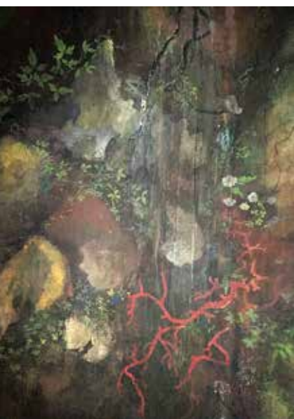
< Groti seinamaaling.

Vatla mõisa tualeti lael ja seintel on säilinud kolm kihti mõisaaegseid tapeete, kahel neist on esmasel vaatlusel säilinud ka bordüür. Kaks esimest kihti pärinevad 19. sajandi keskpaigast. Neist vanem on käsitsi trükitud ja imiteerib rikkalikke õisi kuld kollasel taustal. Teine kiht meenutab kvaadermaalingut – selle muster on jaotatud marmorit imiteerivateks paneelideks, mis vahelduvad grisaille tehnikas teostatud rosettide ja muude detailidega.