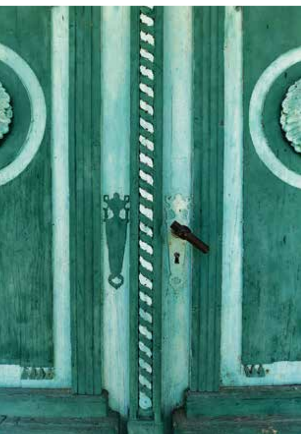
◁ Mõisa peahoone peauks tänapäeval.