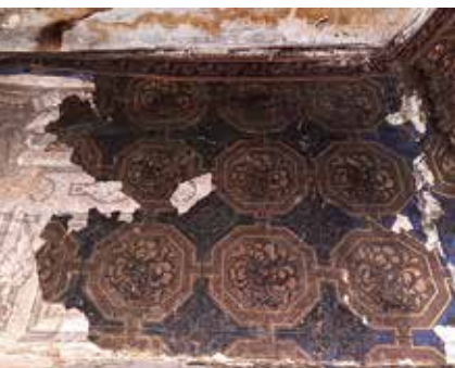
< Tapeedi fragmendid kapptualetis.

väikesesse salongi, mille sein ülemist osa kaunistab savanni kujutav maaling. See avastati 2000. aasta alguses ning restaureeriti 2002. aasta märtsis. Ruume eraldava kaarja ava kohal on veel tänapäevalgi näha kahte konksu, millele on ilmselt kinnitunud eesriie. Selle abil sai grotti visuaalselt muust maailmast eraldada. Tähelepanelik külastaja leiab groti seinas aga veel ühe väikese kaarja salaukse, mis viib esikulaadsesse vaheruumi. Sealt pääseb piki kitsast müüritreppi mõisa teeninduskorrusele.