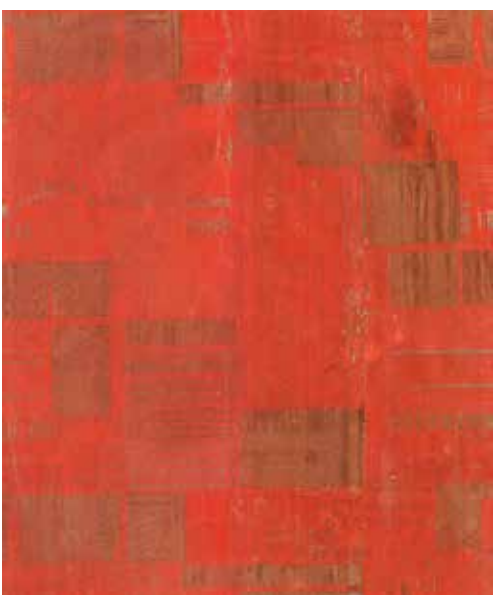
< Funktsionalistlike tapeetide mustrid muutusid 1930. aastate lõpuks väga tagasihoidlikuks – ühetoonilisel taustal kasutati erinevaid geomeetrilisi vorme ja lihtsaid tekstuure. (Tapeet Robert Nermani kogust)