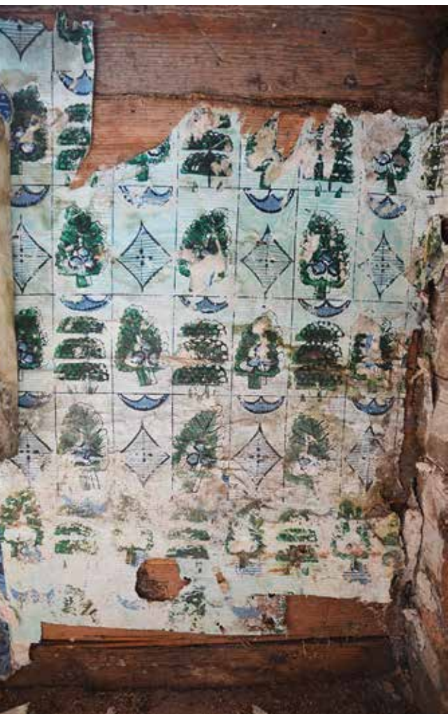
^ Mängukaarte meenutava mustriga tapeet Loodi mõisas 18. sajandi keskpaigast.