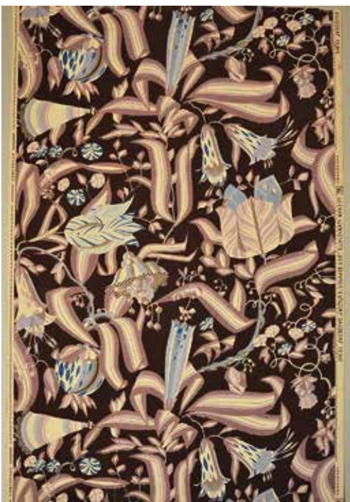
< Wiener Werkstätte koosseisu kuulunud kunstnik Dagobert Peche lõi 1920. aastate alguses mustreid talle omases „teravatipulises barokkstiilis“.