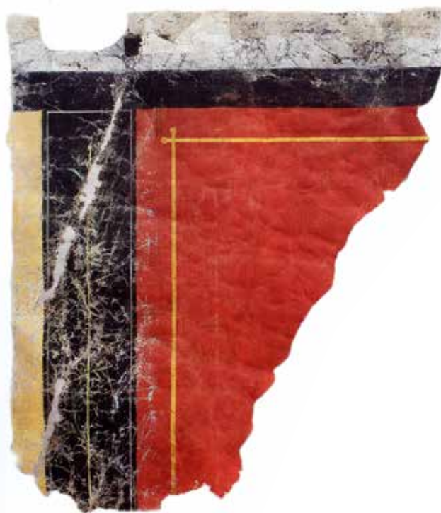
~ 1980. aastatel ehitusprahi seest leitud käsitsimaalitud seinakatte fragment pärast restaureerimist OÜ-s Mandragora.