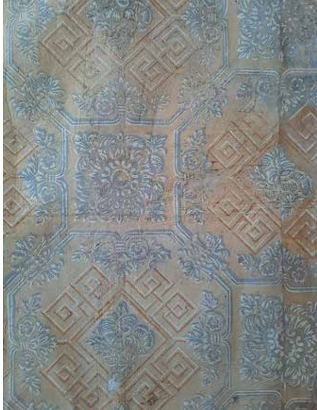
^ Pompei tapeedi alt avastatud varasem, 19. sajandi I poolest pärinev tapeet.