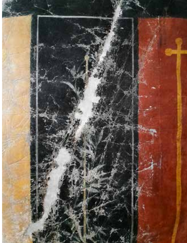
^ Fragment käsitsimaalitud Pompei-teemalisest tapeedist. Hoolimata kahjustusest on ümber kuldse ridva keerduv loorberioks veel selgel loetav.