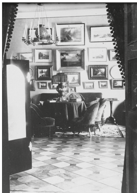
JOONIS 2. Eesti mõisafotodel kohtab ühetoonilisele taustale sätitud kompositsioone enim elutubade ja salongide istumisnurkades ning kabinettides. Kohala mõisa roosa salong 1914. aastast. Foto autor teadmata. ERM Fk 887: 938.

Seinapinna bordüüri ja ühetoonilise tapeedi abil paneelideks jaotamise võte oli tuntud juba 18. sajandi lõpul, kuid selle süstemaatiline väljaarendamine algas alles 1840. aastate Prantsusmaal, kus sellist kujundust hakati kutsuma décor 'iks. 9 Décor koosnes mitmesugustest moodulitest, mille disain põhines eri neostiiilide ornamendikeelel. Eelistatuimad neist olid neorokokoo-, neorenessanss-, Louis XIV ja Louis XVI, vähemal määral ka neogooti ning Idamaadest inspireeritud stiil. 10 Sel perioodil reklaamtrükistena kasutatud litograafiatel on näha dekoratsioone, mille ülesehitus sarnaneb puitpaneelidega, mis koosnesid laiematest ja kitsamatest paneelidest, pilastritest, bordüüridest, nurgikutest, friisist, karniisist ja soklist. 11 Kujunduse