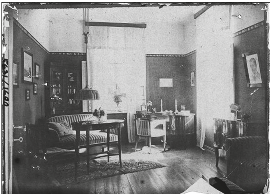
Joonis 7. Moodsas 20. sajandi alguse interjööris paigutati peen bordüür samale joonele, kust varem oli alanud selle juugendstiilile omaselt lai hõimukaaslane. Valge seinapind bordüüri kohal muutis ruumi visuaalselt kõrgemaks. Ülesvõte on tehtud 1920. aastatel. Autor teadmata. AM N 5631: 1690.

interjööridele. Tolleaegse kujunduse põhirõhk asetus bordüürile, mille laius võis kohati ulatuda 50 sentimeetrini. Juugendile omast laia bordüüri võib pida eespool mainitud Inglise kolmeosalise seinakujunduse rudimendiks. Peenemates interjöörides kombineeriti bordüür laekarniisi ja maalitud laega, nagu näiteks Sagadi mõisa (Haljala khk) saalis. Ainus tänini terviklikuna säilinud tapeedi-bordüüri näide asub Tartus Eesti Kirjandusmuuseumi hoones ühes 1890. aastatel kujundatud salongis (tahvel 12). Kerge ja naiseliku õhkkonna loomiseks on ruumis kasutatud heledat hõreda mustri tapeeti, mis rõhutab ruumi mastaapsust ning muudab selle valgusküllaseks.