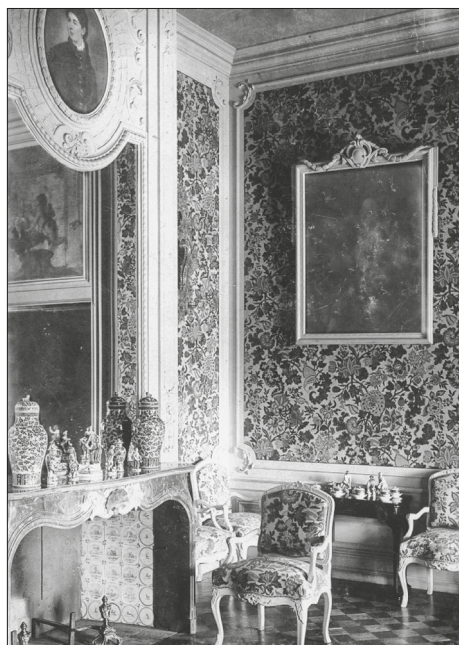
JOONIS 3. Vastavalt historitsismi põhimõtetele kujundati Alatskivi mõisa salong naiselikus neorokokoostiilis. Seinapaneele ehtiv muster kordub ruumi pehme mööbli katetel. Ülesvõte on tehtud 1910. aasta paiku. Selle autor on teadmata. AM 13741: 328 F 17645.

Tahvlistest koosnev seinakujundus tuli Eestis kasutusele arvatavasti 1870. aastatel. Seda kasutati enamasti külaliste vastuvõtmiseks ettenähtud ruumides, eelkõige salongides ning suitsu- ja söögitubades. See keerukas seinaskeem viitas pererahva jõukusele ja heale maitsele. Seni teadaolevalt kõige paremini säilinud tahvlistest koosnevad seinakujundused on Puurmani mõisa (Kursi khk) söögitoas ja mõisa perenaise riietumisruumis, kus küll enamik tapeedist on kaetud hilisema neorokokoo puitdekooriga. Tapeeditahvlite fragmente on leitud ka Väana mõisa ühest salongist ja mitmest Olevimägi 14 ruumist Tallinnas.