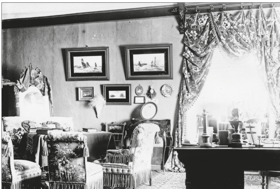
JÕONIS 1. Ajalooliste fotode puhul on tavaliselt keeruline öelda, kas ühetoonilised seinad on kaetud tapeediga või värvitud. Kassari mõisa salongi seintel on selgelt näha ühetoonilise tapeedi paaniservad. Ülesvõtte on tehtud 1891. aastal. Foto autor teadmata. HKM Fp 901: 15 F 4547.

Objektide asetus jäi ruumi kasutaja otsustada. Tema ülesandeks oli luua kompositsioon talle olulistest kunstiteostest ja fotodest, mis viitasid tema peresidemetele, vaadetele, haridusele ja maitse-eelistustele kujutavas kunstis.