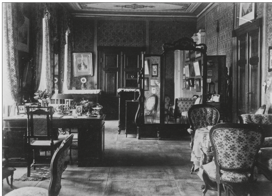
JOONIS 4. Lillelised pinnad on selle ruumi võtmesõna. Peale kardinate ja mööbli katteride kaunistavad lilled ka seinu. Kose-Uuemõisa kabineti-salongi seinad on maitsekalt liigendatud bordüüri ja ühetoonilise tapeediga raamistatud tahvliteks. Maalitud lagi moodustab seinte ja mööbliga ühtse koosluse. Ülesvõte on tehtud 1911. aastal. Selle autor on teadmata. ERM Fk 887: 399.

Terviklikuna säilinud näiteid võib leida mitmelt ajalooliselt ülesvõttelt. Üks sellistest on Kose-Uuemõisa mõisa (Kose khk) kabinet-salong, kus seinakujundus loob maalitud lae ja kardinate ning mööblikanga lillelise mustriga ühtse koosluse (joonis 4). Vorbuse mõisa (Tartu-Maarja khk) muusikatuba ja Pärnuri mõisa (Peetri khk) punast saali kujutavatel ülesvõtetel on näha, kui hästi rõhutab tahvliteks jaotatud seinapind esinduslike ruumide mastaapsust. Väiksemates ruumides mõjuks selline kujundus kokkupressitu ja närvilisena. Seinajaotamise võtet kasutati esinduslikes ruumides veel 1920.–1930. aastatel Eesti Vabariigi ajal. Mitmel 1930. aastatest pärineval Toila-Oru lossi (Jõhvi khk) interjööri kujutaval fotol on näha luksuslikku seinakujundust, mis oli omane 19. sajandi teise poole interjööridele.