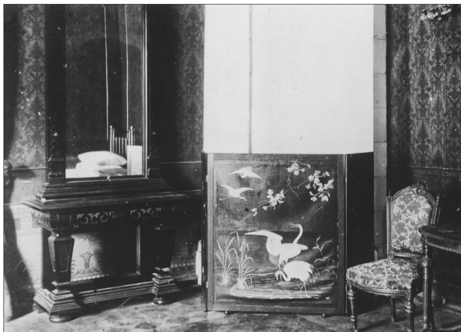
JOONIS 6. Inglise interjööridele omaseid horisontaalselt kolmeks jaotatud seinakujundusi kohtab Eestis harva. Päinurme mõisa vaibatoa seinakujundus viitab Inglise mõjudele. Fotol on näha trükitud lambrii, tapeet ja nende kahe kokkupuute piiri markeeriv lai bordüür. Ülesvõtte aeg ja autor teadmata. ERM Fk 887: 180.

selt kaheks või kolmeks osaks: lai bordüür, seina üldpind ja neile mõnikord lisanduv lambrii. Tihti isegi viiekümne sentimeetri laiused bordüürid jäljendavad arvatavasti Jaapani interjööridele omaseid ranma puitlõikeid, mida kasutati ruumi ventileerimiseks. Euroopa ruumikujunduses taandus nn ranma -alaid dekoratiivseks detailiks. Anglojaponistlikes ruumides kaeti kogu sein tapeediga: trükitud lambrii, seina üldpinda kattev tapeet ja bordüür. Kolme pinda puutejoont võidi omakorda toonitada bordüüriga. Sellist seinakujundust kasutati eelkõige trepikodades ja koridorides.